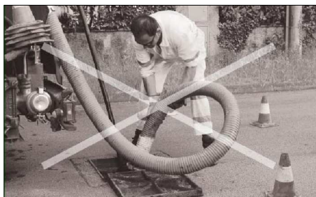
AUTOBOTTE ESPURGO + CANAL JET (sistema sconsigliato)

L'escavatore a risucchio permette una preventiva aspirazione del materiale depositato presso l'accesso alla caditoia ma soprattutto consente una rimozione rapida e puntuale del materiale depositato all'interno di essa. Poiché il lavoro viene svolto, a differenza dell'autobotte, in assenza di acqua, è minore il rischio di trasferire alle tubazioni di valle materiali solidi o fangosi.