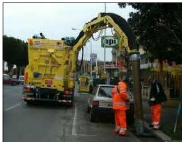
ESCAVATORE A RISUCCHIO (sistema consigliato)